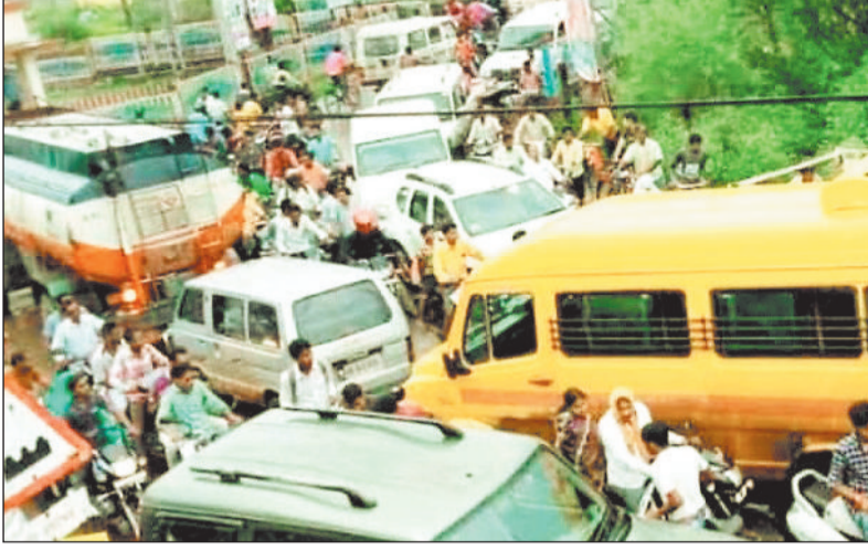
खरसिया रेलवे फाटक पर लगी जाम।

बीते 5 सितंबर को सीएम विष्णु देव साय ने खरसिया आरओबी का भूमिपूजन किया था। जनता को भरोसा था कि वर्षों से लंबित यह पुल अब तेजी से बनेगा और शहर को जाम और जर्जर सड़कों की समस्या से छुटकारा मिलेगा, लेकिन आज तक न तो काम शुरू हुआ न ही कोई समय-सीमा तय की गई। दूसरी ओर आरओबी निर्माण की तैयारी के नाम पर कई बार सड़कें खोदी गईं, रास्ते बदले गए, यातायात अव्यवस्थित हुआ। लेकिन निर्माण की एक ईंट भी नहीं रखी गई। सड़कों पर इतने गड्डे बन चुके हैं कि दोपहिया वाहन चलाना अब जोखिम से भरा सफर बन गया है। प्रोजेक्ट की लगभग लागत 64.95 करोड़ रुपये स्वीकृत है राज्य और केंद्र दोनों स्तर पर इसे मंजूरी भी मिल चुकी है। इसके बावजूद, निर्माण प्रक्रिया आगे नहीं बढ़ सकी।